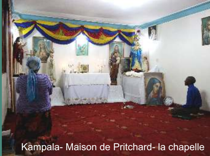
Kampala- Maison de Pritchard- la chapelle

Administrativement parlant, grâce aux efforts de nos fidèles, la FSSPX a été homologuée par le gouvernement et nous pouvons obtenir des visas de résidence.