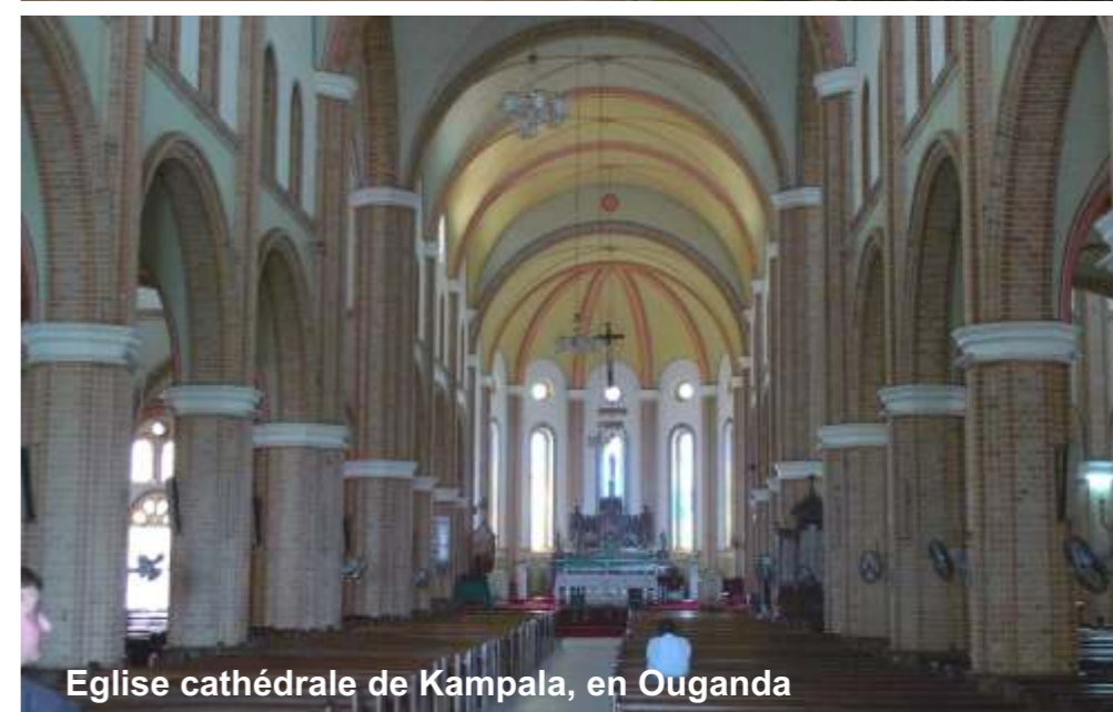
Eglise cathédrale de Kampala, en Ouganda