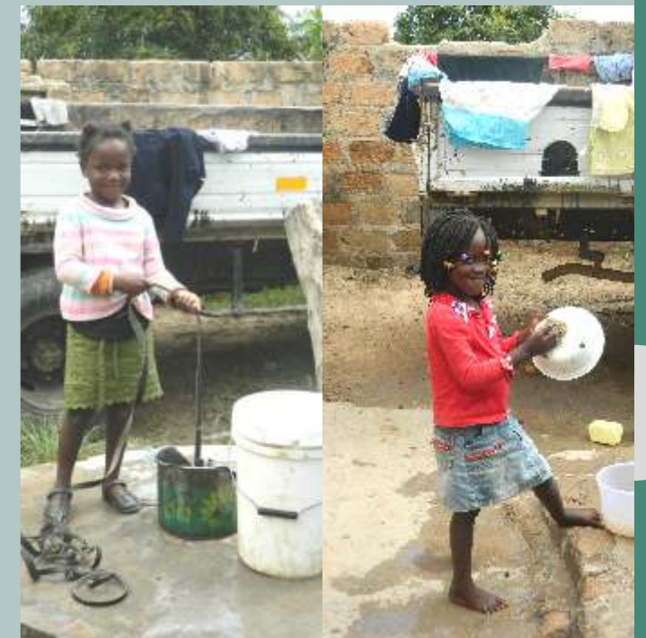
Ici tout le monde aide ! Une jeune fidèle puise l'eau pendant que l'autre fait la vaisselle avec le sourire